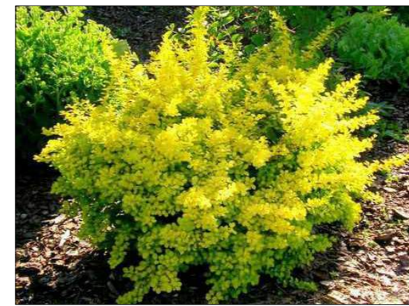
berberys Thunberga 'Aurea'