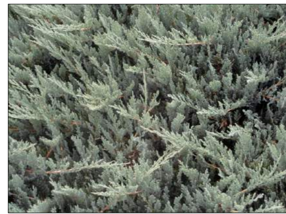
jałowiec płozący 'Winter Blue'