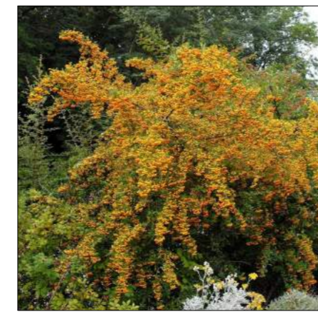
ognik 'Soleil d'Or'