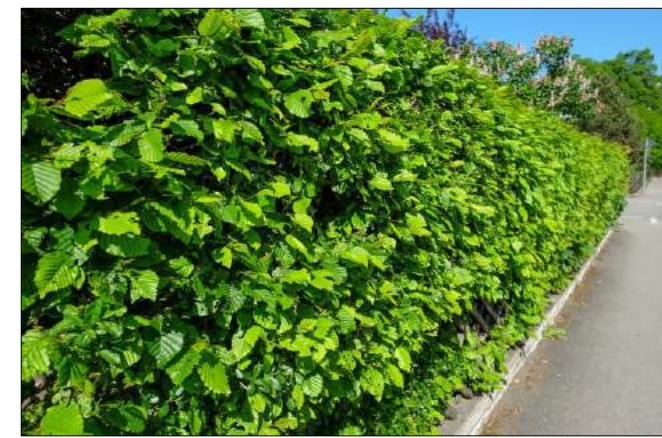
grab pospolity - żywopłot