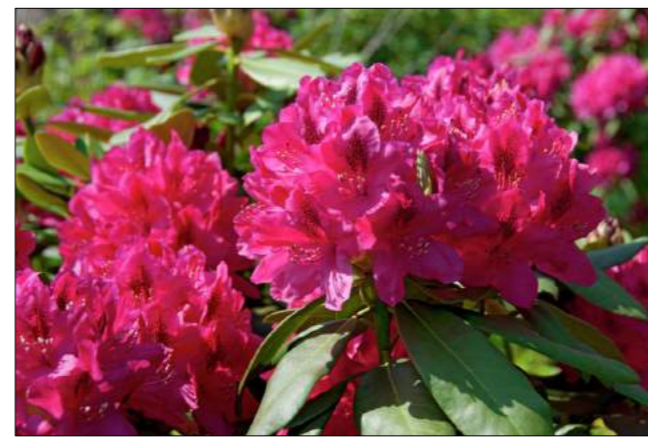
rózaniecnik 'Nova Zembla'