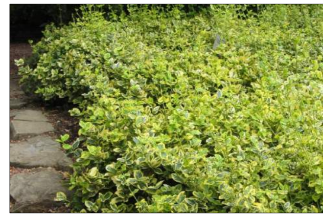
trzmielina Fortune'a 'Emerald 'n' Gold'